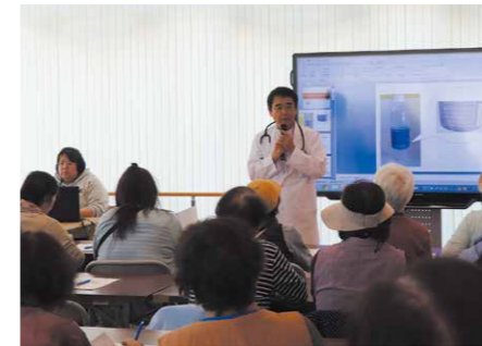
当院では定期的に糖尿病健康教室を開催しています

2型糖尿病患者さんの健康寿命、生活の質を守るためには、糖尿病による心筋梗塞、狭心症、脳卒中、下肢動脈閉塞、心血管病などを防ぐことが重要です。高血糖を放置すると、インスリン(血糖値を下げるホルモン)を作ることができない細胞(膵β細胞)の働きが鈍ったり数が減ったりします。この状態を放置すると、最後はインスリン治療が必要な状態になってしまいます。それを防ぐために当院では膵β細胞の機能が回復するよう、1~2週間の入院による短期強化インスリン療法を行っています。まずは外来にてお気軽にご相談ください。